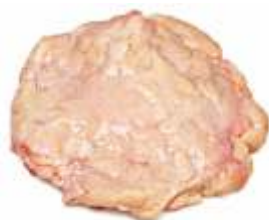
Жир яловичий внутрішній