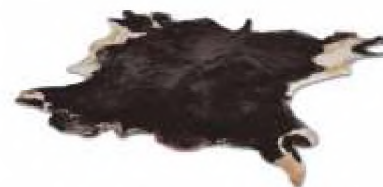
Шкірсировина (ВРХ) мокросолена