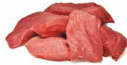
М'ясо знежилване блочне вищий сорт