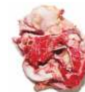
Обрізь від субпродуктів