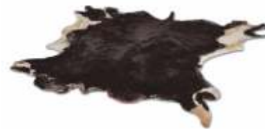
Шкірсировина (ВРХ) мокросолена