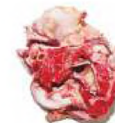
Обрізь від субпродуктів