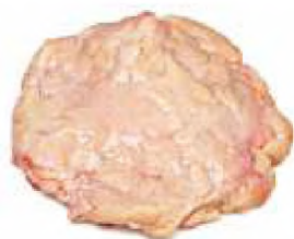
Жир яловичий внутрішній