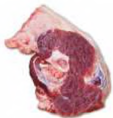
Інші субпродукти 2-ї категорії