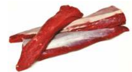
Філейний край /полядвиця/