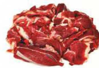
М'ясо знежилване блочне II сорт