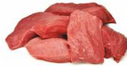
М'ясо знежилване блочне вищий сорт