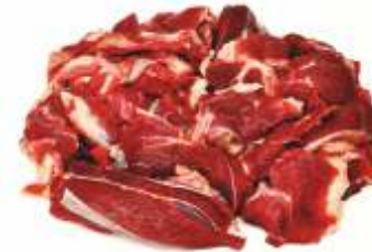
М'ясо знежилване блочне II сорт