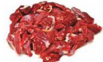
М'ясо знежилване блочне I сорт