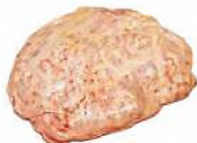
Жир яловичий кишечний