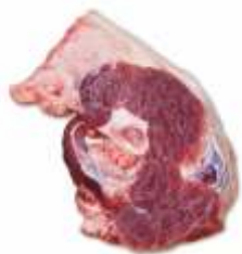
Інші субпродукти 2-ї категорії