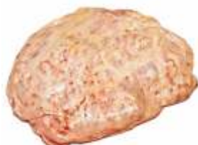
Жир яловичий кишечний