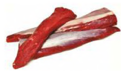
Філейний край /полядниця/