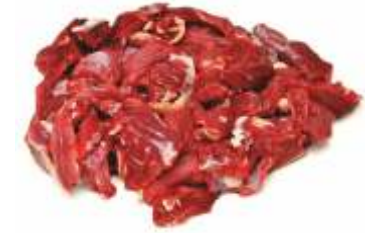
М'ясо знежилване блочне I сорт